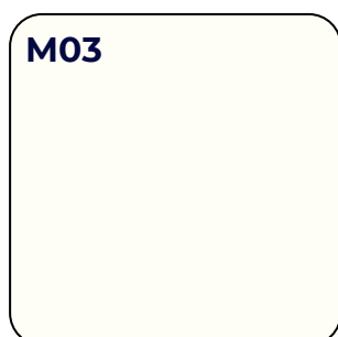
KRISTALWIT U 11026 VV