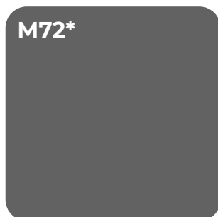
ANTRACIETZWART U 12290 MP