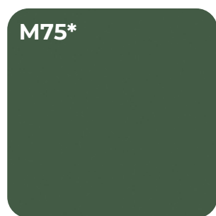
LABRADOR U 19008 SD