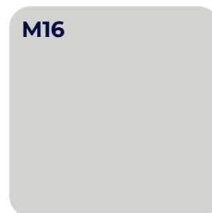
ZILVERGRIJS U 12131 VV