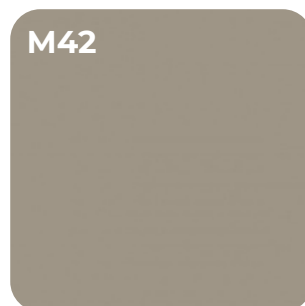
CONGO U 16002 VV