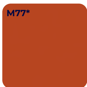
SIENA ROOD U 16051 SD