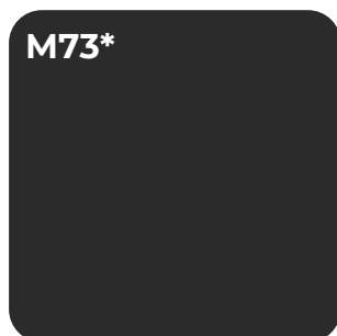
ZWART- NERF U 12007 NW