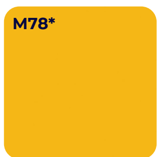
BREMGEEL U 15115 SD