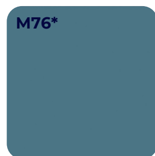
ATLANTIC U 18074 SD