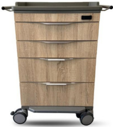
Wagen op afbeelding: LW (105 cm hoog)