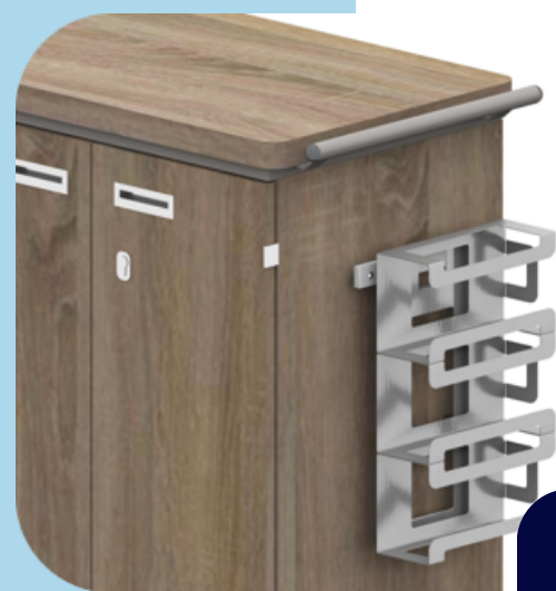
Handschoenen houder -3delig