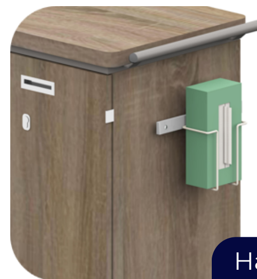
Handschoenen houder - enkel